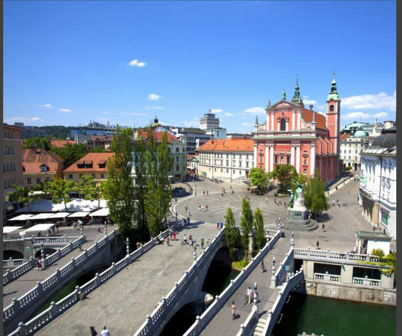
Trojmostí v Lublani, 1932