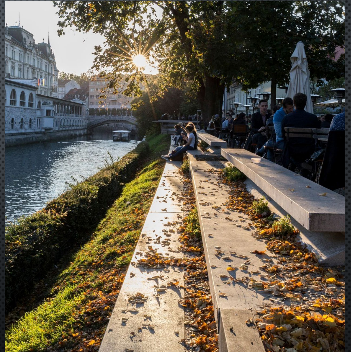
Úpravy nábřeží řeky Lublaňka v Lublani, 30. léta 20. století