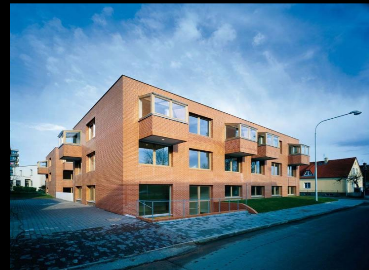
Nová budova FA ČVUT v Praze, 2011, dům s pečovatelskou službou v Horažďovicích, 2000