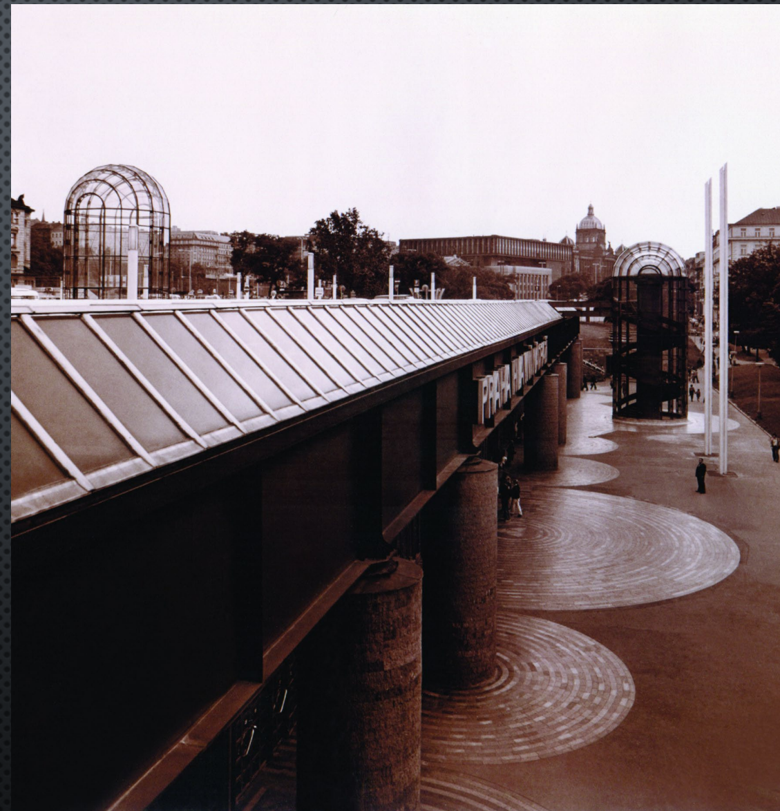
Dům na Můstku v Praze, 1983, a odbavovací hala Hlavního nádraží v Praze, 1977