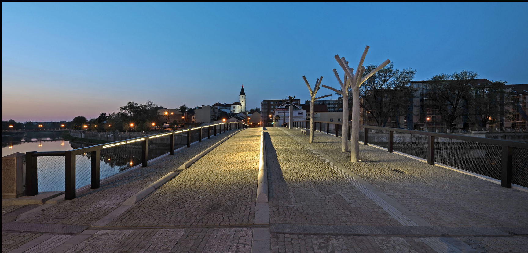
Tyršův most v Přerově, 2012