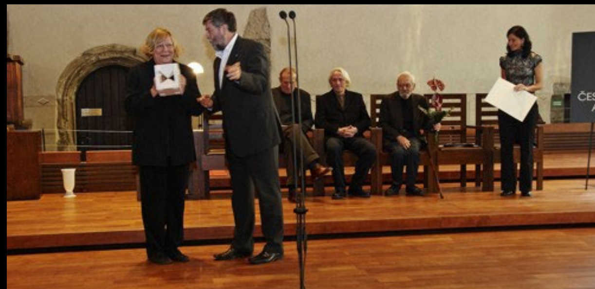
Alena Šrámková – první dáma české architektury (1929–2022)