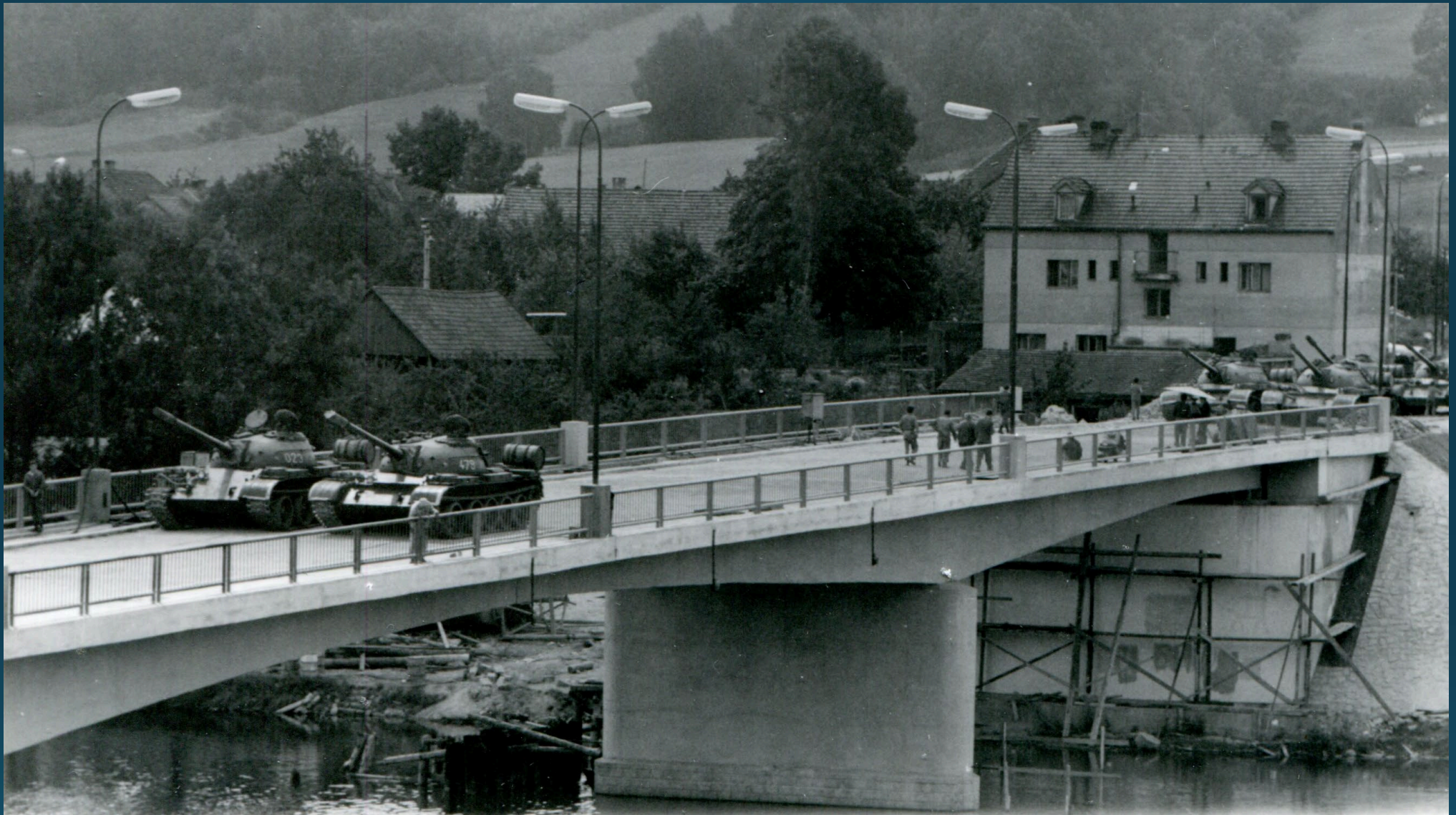
Zatěžkavací zkouška železobetonového mostu českými tanky, červenec 1968.