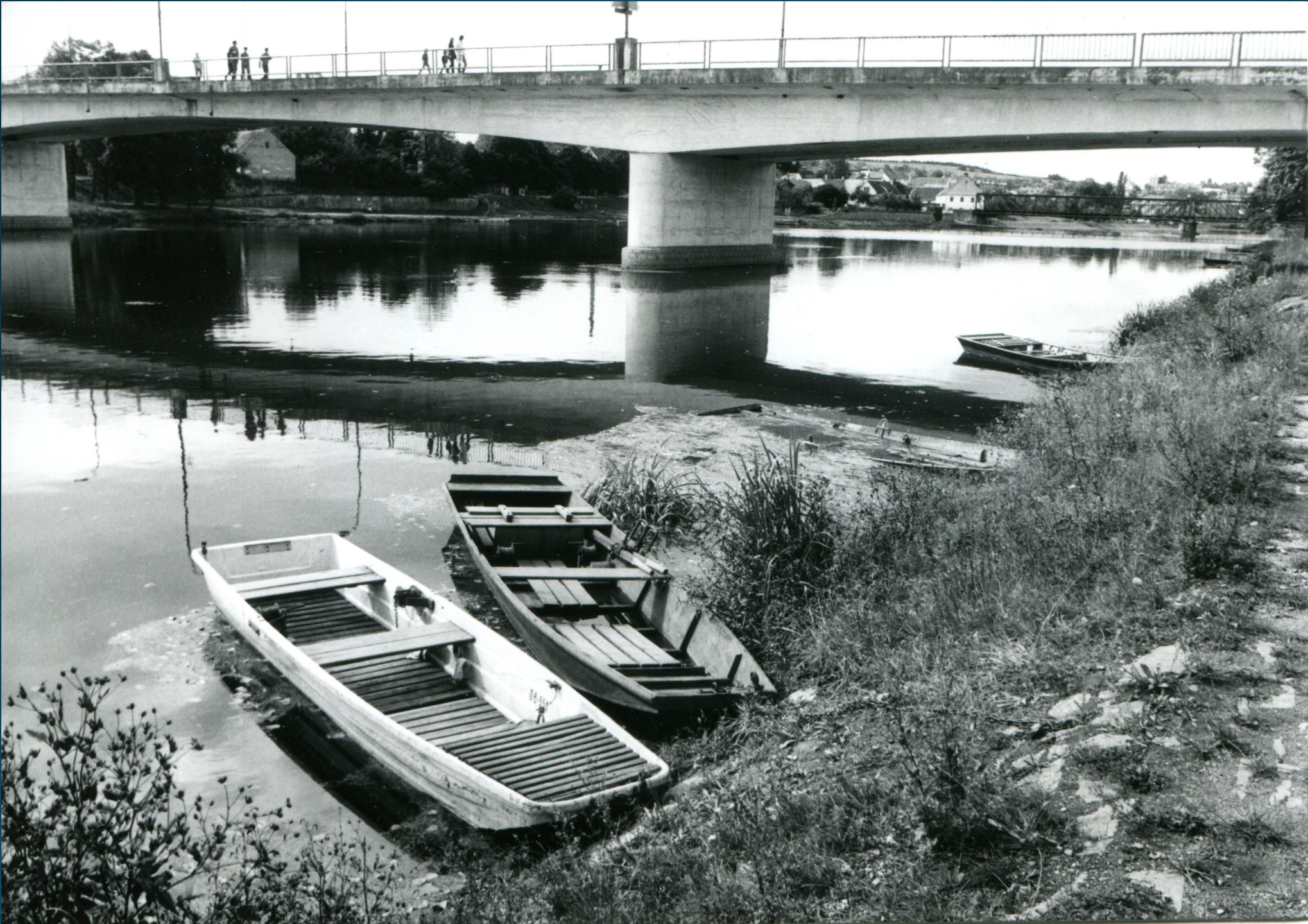
Pohled na Nový most z nábřeží 5. května, 80. léta 20. století.