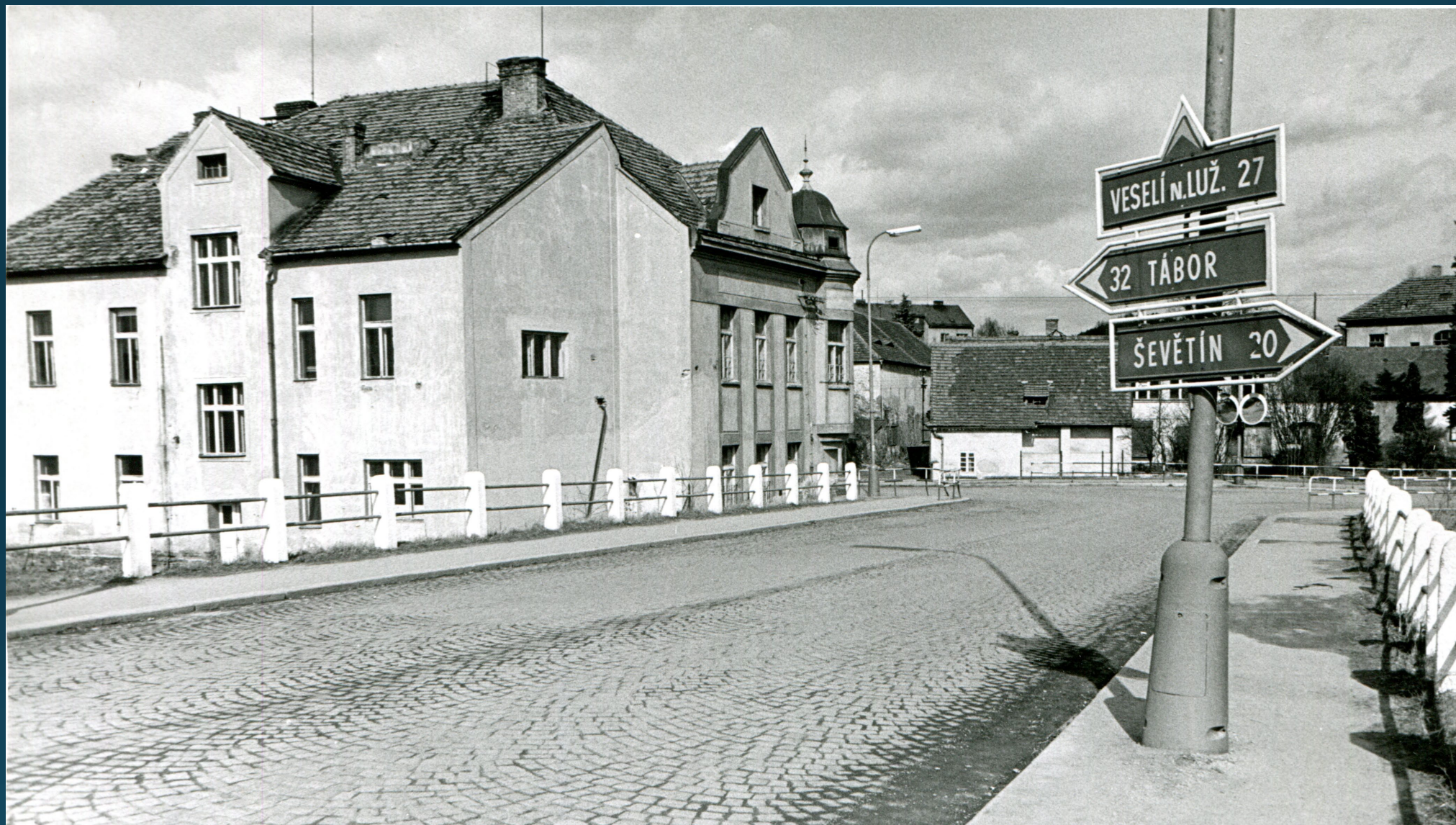
Pohled z Mostu 28. října (tzv. Nového mostu) na pravý břeh, budova záložny - OÚNZ těsně před demolicí, snímek z 15. 3. 1981.