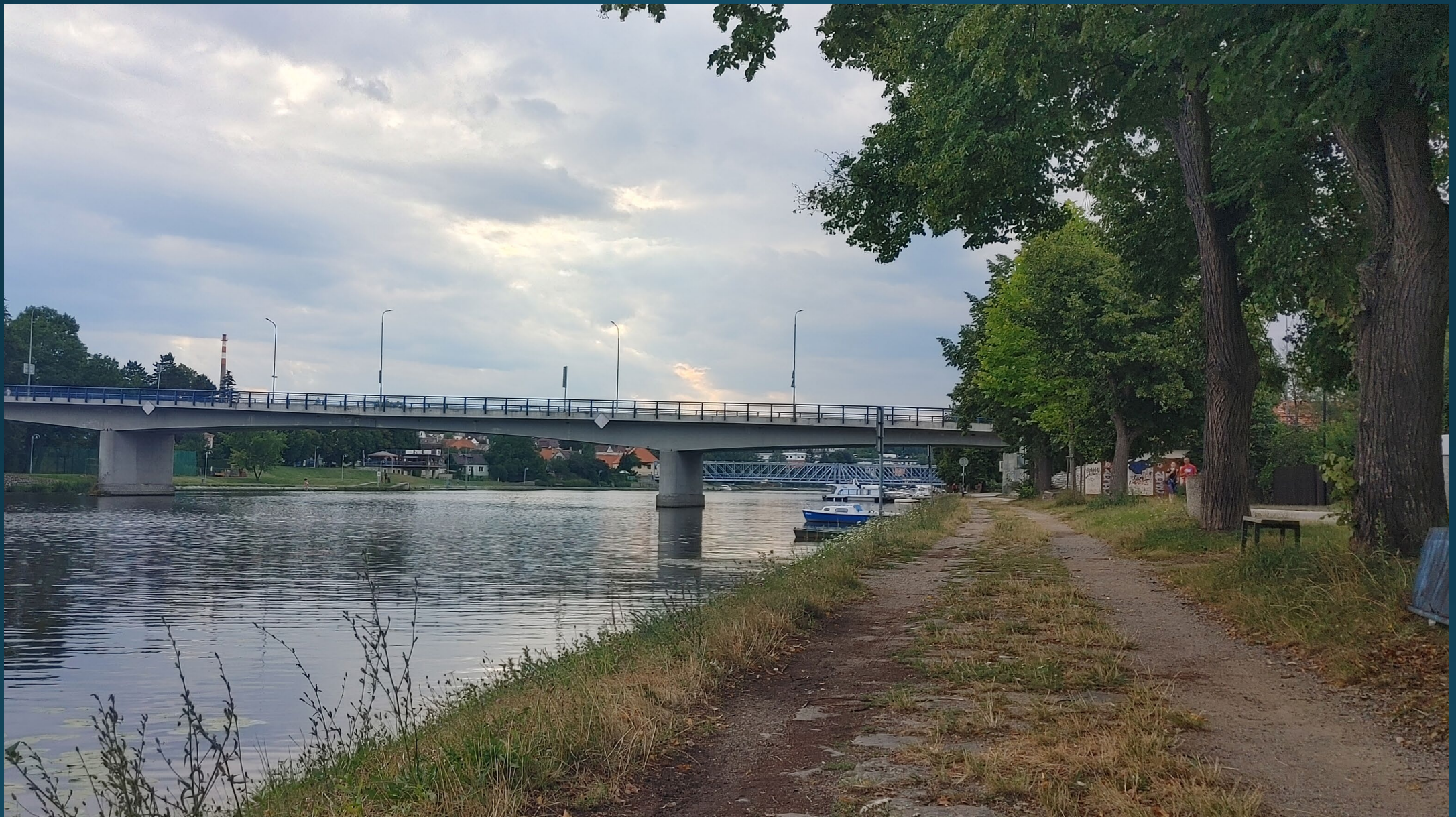
Současný stav mostu.