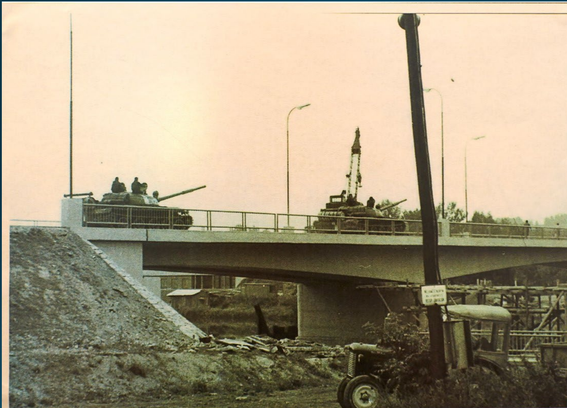
Neplánovaná zátěžová zkouška sovětskými tanky v srpnu 1968.