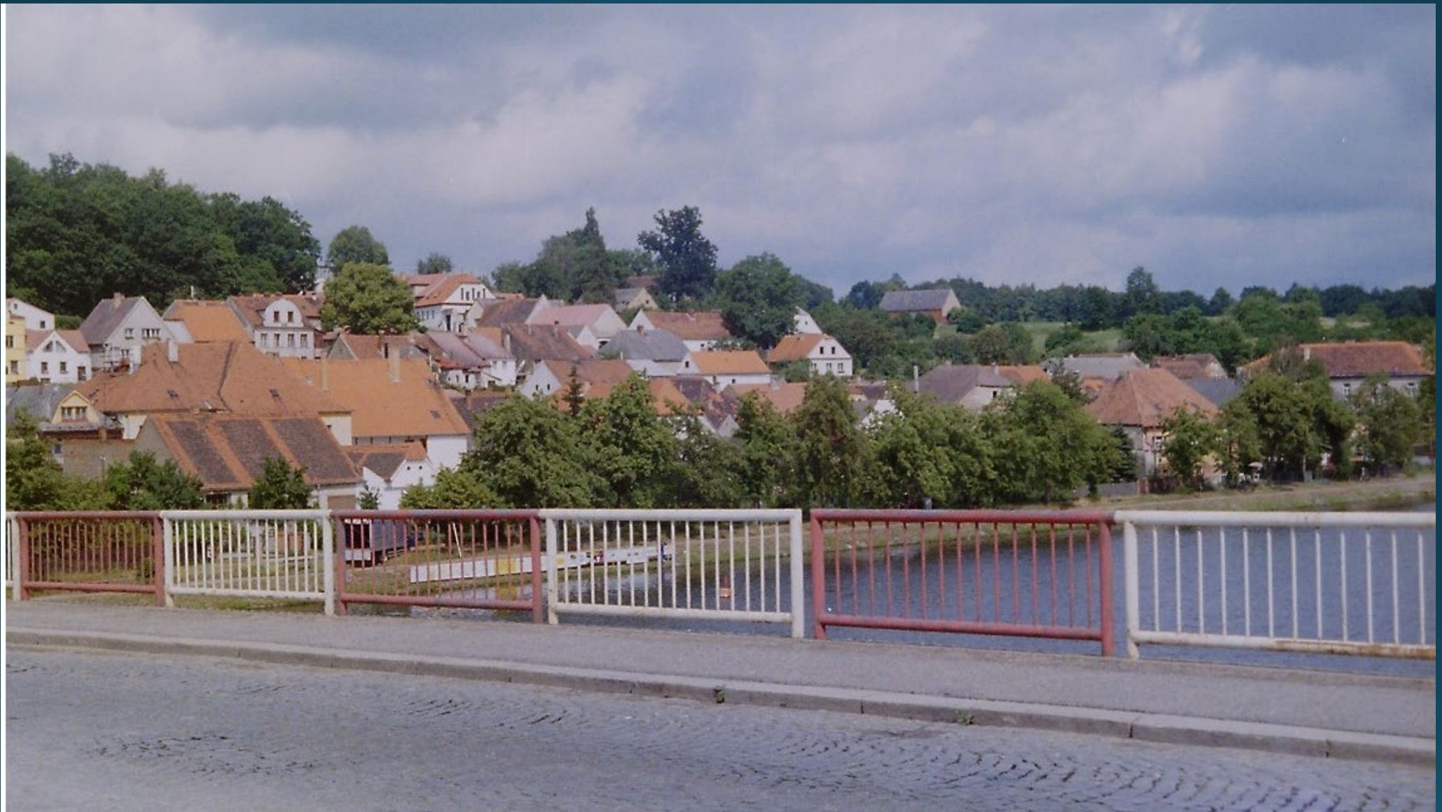
Zábradlí na mostě před jeho opravou v roce 2004.